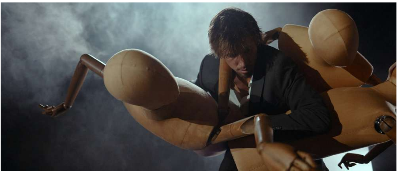
Imagen del proceso de investigación del personaje “Salaryman” en “La senda del manso”

(Video creación “5 mansos” en el lago de Los Barruecos, Cáceres: https://vimeo.com/650097636 . Música original de Ed is Dead. Contraseña: mansos)